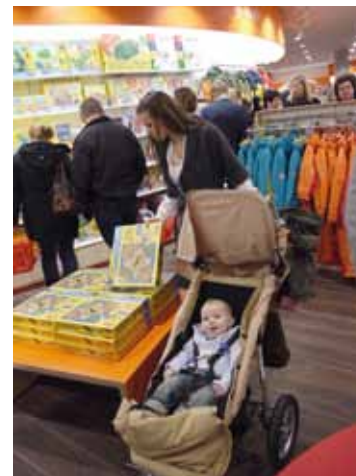
In den JAKO-O Filialen können Eltern entspannt einkaufen.

bei uns im Norden ist“, sagt eine Kundin in der JAKO-O Filiale. Mit der zusätzlichen Filiale geht JAKO-O auch auf die Familien ein, die lieber vor Ort statt online einkaufen.