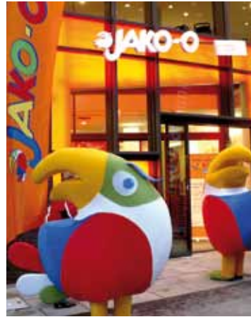
Bei der Shop-Eröffnung begrüßten zwei JAKO-O Tukane die Hamburger.

Trotz Wirtschaftskrise erlebt die deutsche Spielzeugbranche einen Aufschwung. In Deutschland geben laut dem Bundesverband des Spielwaren-Einzelhandels Eltern immer mehr Geld für Kinderspielzeug aus: Durchschnittlich 150 Euro in diesem Jahr, vor fünf Jahren waren es noch 50 Euro weniger. Allerdings werden nicht etwa mehr Teddys, Puppen oder Feuerwehrautos gekauft, sondern eher ein höherer Preis für hochwertiges und langlebiges Baby- und Kleinkindspielzeug gezahlt. Langlebiges und funktionales Spielzeug können Familien nun auch im JAKO-O Geschäft in der Hamburger Innenstadt kaufen. „Wir freuen uns so, dass JAKO-O endlich auch