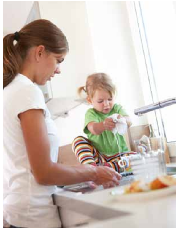
Gut wenn der Nachwuchs schon selbstständig ist und bei kleinen Tätigkeiten im Haushalt mithelfen kann.

Wenn der Grippevirus die betreuende Mutter erwischt hat, helfen Ruhe und viel Schlaf. Daher sollten wichtige Utensilien wie die Wasserkaraffe und Leckereien für die Kranke, das Milchfläschchen sowie das Gläschen mit Obstbrei (der schmeckt auch kalt) für das Kind in Reichweite liegen.