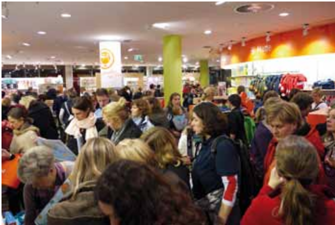
Am Eröffnungsabend besuchten hunderte Neugierige die neue Hamburger JAKO-O Filiale.

JAKO-O ERWEITERT EINKAUFSMÖGLICHKEITEN FÜR FAMILIEN